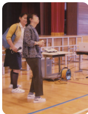
↑成美爆笑おたっしや劇団による寸劇