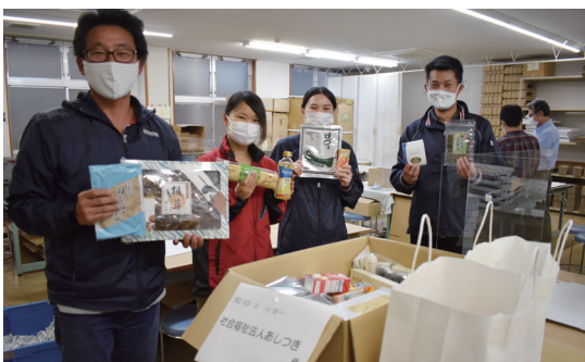
社会福祉法人あしつきの皆さま