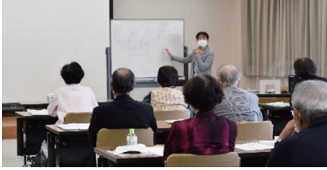
〔高岡会場〕富山家庭裁判所 乗地主任書記官