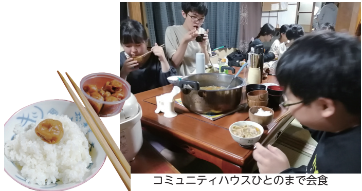
コミュニティハウスひとのまで会食