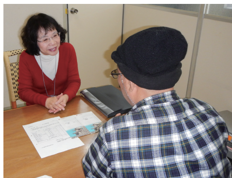
▲実際の活動の様子